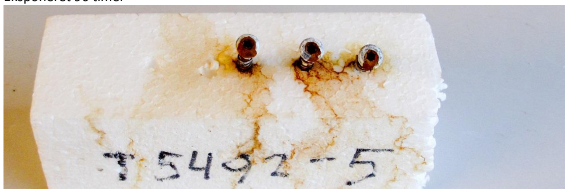
Eksporeret 196 timer