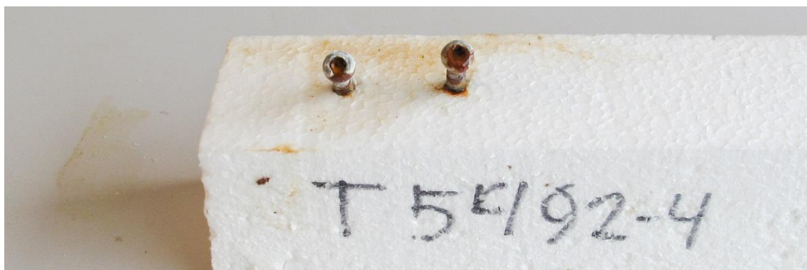
Eksporeret 24 timer