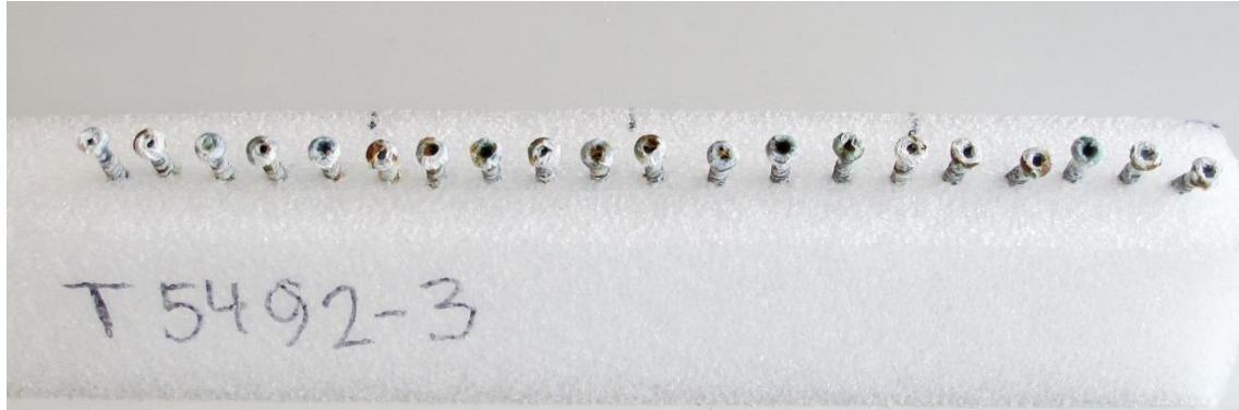
Eksporeret 24 timer