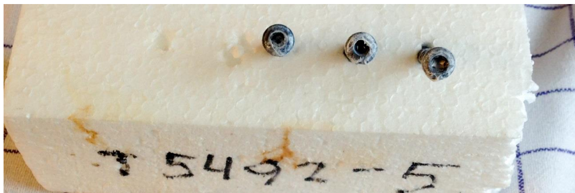
Eksporeret 24 timer