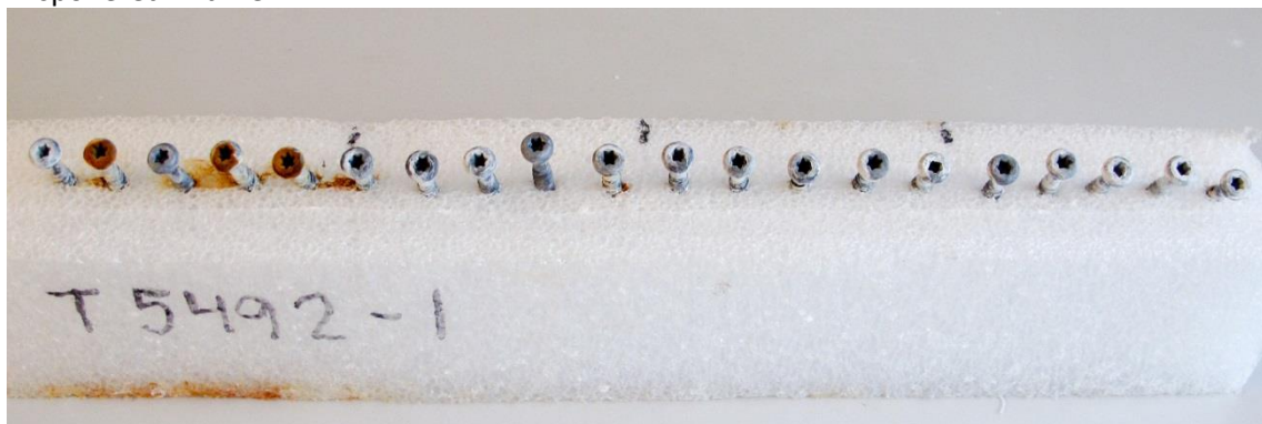
Eksporeret 334 timer