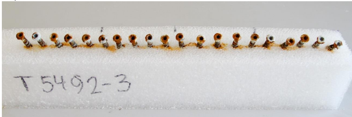
Eksporeret 49 timer