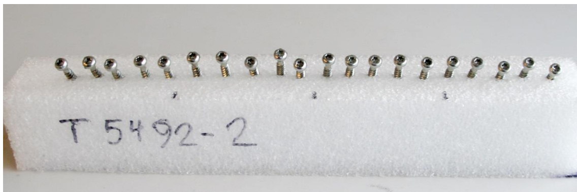
Eksporeret 24 timer