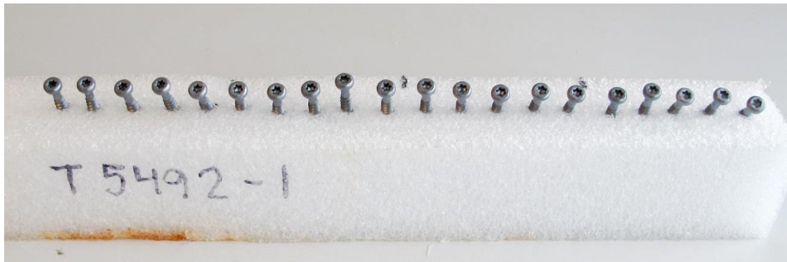
Eksporeret 24 timer